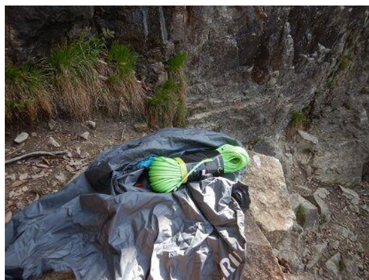
エーデルリッド・トミーコードウエル仕様 Φ3.8mm×60m ロープ