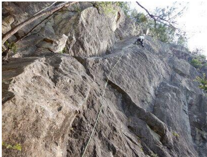
「太陽がいっぱい・5-9」 烏帽子岩の代表的ルートです