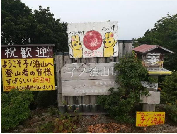
賑やかな山頂の標識