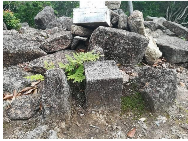
立派な一等三角点