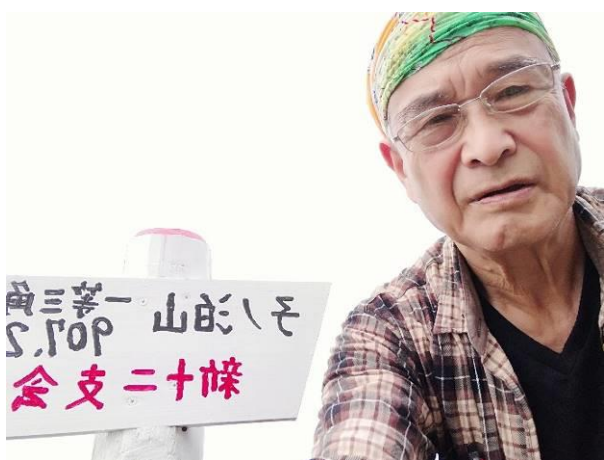
新十二支会ができてます