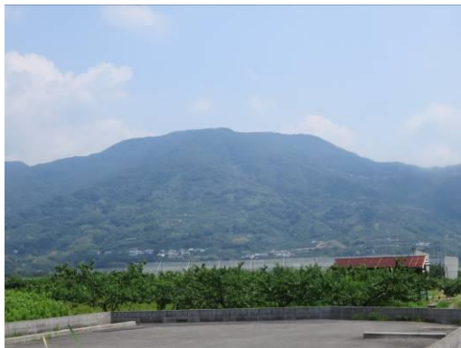
北側からの龍門山

登山口は標高300mほどである。田代峠へは急登で雑木と松の林である。足元は緑色の変成岩である蛇紋岩が卓越する。紀ノ川や四国の吉野川に特徴的な地質である。田代峠からはなだらかな尾根歩きで山頂に着く。山頂からは紀ノ川の流れと和泉山脈が眺望できる。明神岩は北向きに切り立った岸壁でクライミングに適している。中央コースは急坂であるがよく整備されたコースであり、登り口には10台程度の駐車場があり、一本松とは車道で繋がっている。下山後、天然鮎の塩焼きを予約した有田川上流の食堂まで県道19号を走ったが、山中の実に酷い道であった。それでも結構多くの家があり、人も住んでいるようであった。