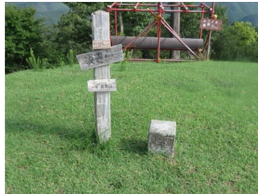
真妻山山頂 一等三角点(523.4m)

【コースタイム】7:00 大滝川登山口 (h=180m) ・ ・ 8:40 真妻山 (523.4m) 9:00 ・ ・ 10:00 大滝川登山口