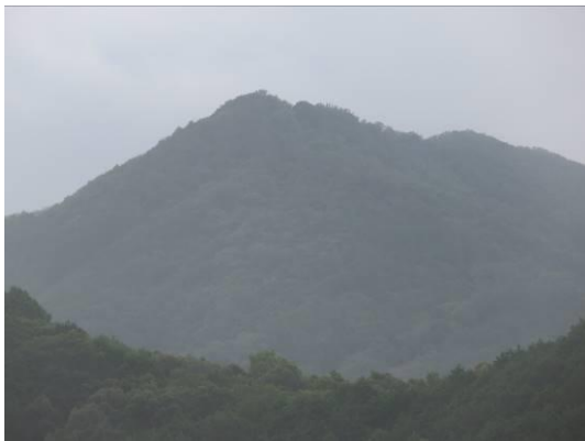
西側から見た真妻山

往路下山して、帰路、有田川温泉で汗を流した。京都へは京奈和道が橿原まで完成して無料供用しているので、それを利用した。真夏の太陽のもと、夏山登山の雰囲気を楽しめた山行であった。