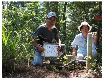
秋葉越三角点にて