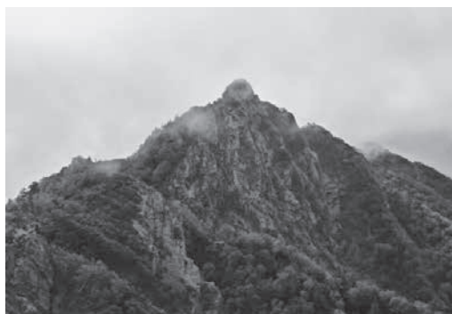
三角点ピークからの第一高点