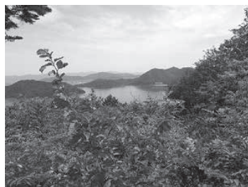
展望広場より織山（中央）と津田山