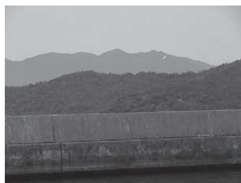
沖ノ島より武奈ヶ岳