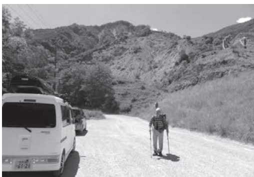
林道ゲート300m手前付近にて