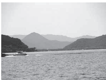
沖ノ島より三上山