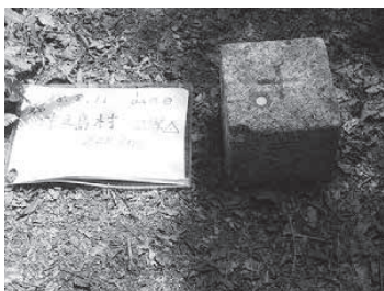
沖之島村2等三角点