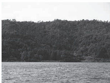
船上より沖ノ島山