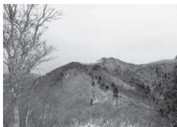
御殿山からの武奈ヶ岳

7:00三条京阪集合—8:00坊村8:10…10:00 (P846) …11:00御殿山 (1,097) …12:00武奈ヶ岳 (△1,214.4 昼食) 12:30…13:30 (P846) …14:30坊村—15:20朽木温泉 (入浴) 16:10—17:20 出町柳駅前 (解散)