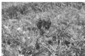
キタザワバシ (トリカブト属)