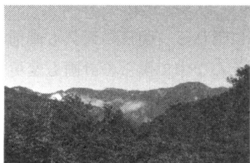
白樺荘からの茶臼岳 (右側ピーク)