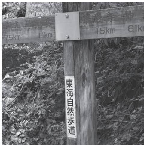
道標 妙法ヶ岳まで1,1km