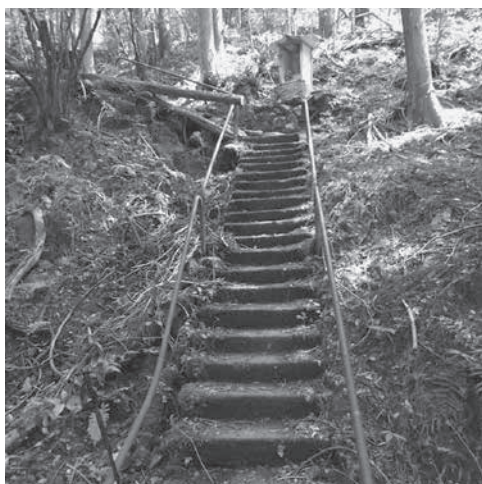
杉林の中の階段道

横山ダム・坂内村・金居原・杉野・高時川と懐かしい名前の看板を目にする。土蔵岳・横山岳・墓谷山 各登山口の看板も目にする，大分昔の話が，思い出される。R8に出て少し戻って木之本ICから帰った。