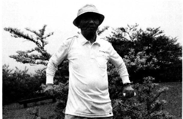
米寿記念品のポロシャツ贈呈後，さっそく着用される